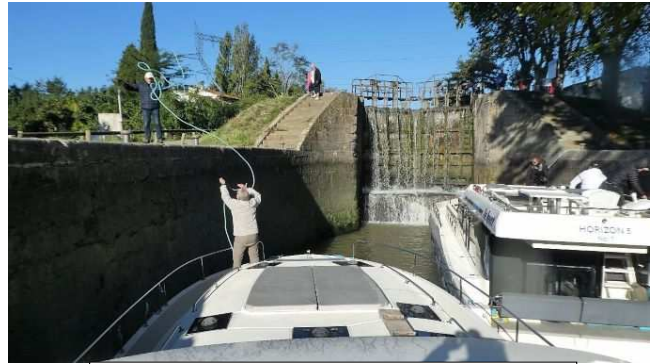
Magnifique lancer d'amarre !!