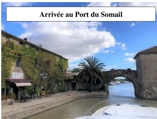
Arrivée au Port du Somail

• 16h30 arrivée aux portes de LE SOMAIL Amarrages cul à quai et quartier libre jusque 18 h c'est-à-dire le RDV de l'apéro sur les bateaux avec les restes de boissons diverses et crustacés de ce midi. Et après il faudra aller dîner ! Dure dure, la vie de retraité en goguette.