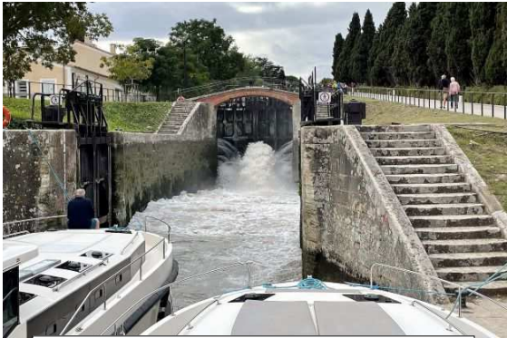
A l'entrée des écluses de FONSERANES Courage. Il faut y aller !!!