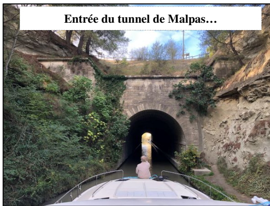
Entrée du tunnel de Malpas...

Peu après le départ passage du tunnel de MALPAS, puis ensuite au point Km 196,5, le pont très étroit et très bas dit PONT de REGIMONT. Nous y avons frotté les mains courantes en inox du pont supérieur car tout passe à 5 cm. Il faut quasiment se jeter à plat ventre sur le pont supérieur, autant dire qu'il faut prévoir la trajectoire, baisser les têtes, rentrer les ventres et laisser faire. Jusqu'à ce que l'arrière du bateau soit sorti : d'autant plus que le Vision 3 est le bateau le plus haut de la flotte avec 5cm de marge,