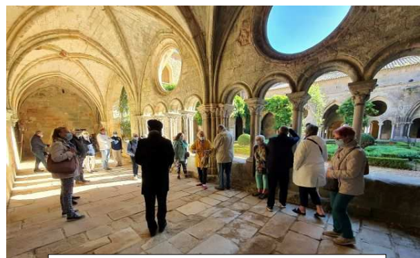
Le groupe et le guide dans le cloître de l'Abbaye de Fontfroide